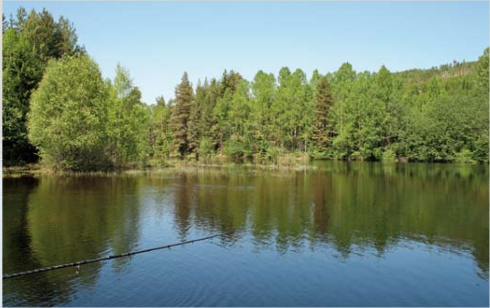
Mega-Spannend: Hechtfischen in den flachen Buchten und Flusseinläufen des Randsfjords

wird kaum beachtet und kann sich daher ungestört entfalten. Wir fingen in sechs Angeltagen etwa 75 Hechte über 60 Zentimeter und noch einige schöne Barsche – und ich möchte nicht wissen, was erfahrene Angler erst gefangen hätten! Eines ist sicher: Der Randsfjord ist ein Revier, das sowohl absoluten Neulingen wie mir als auch erfahrenen Hechtprofis so manche zähnestarrende Überraschung bescheren wird!