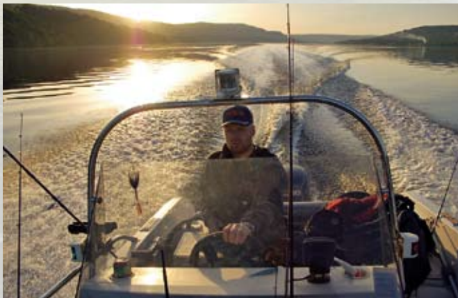
Mit 50 PS am Heck macht der Platzwechsel Spaß!

Sofort machten wir uns auf, das riesige Gewässer zu erkunden. Ungeduldig warf ich meinen Wobbler zum ersten Mal aus – direkt vor einen im Wasser liegenden Baumstamm. Sofort erfolgte eine heftige Attacke, mit der ich so schnell gar nicht gerechnet hatte. Natürlich ging